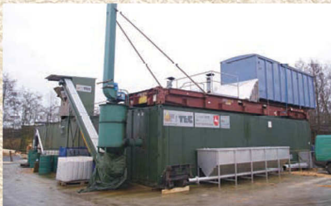
ピーテックのバイオ燃料製造・利用実験プラント。木材チップ貯蔵室、製造機、発電機等、全てコンテナで運べるようユニット化している。この規模で一日約60トンの木材処理能力がある。

(注)このバイオ燃料は酸性のため、このままでは通常のディーゼルエンジンには向かない。